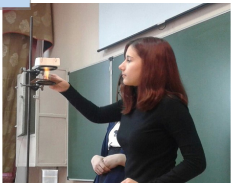
кадр из видеоролика 7 «б» класса