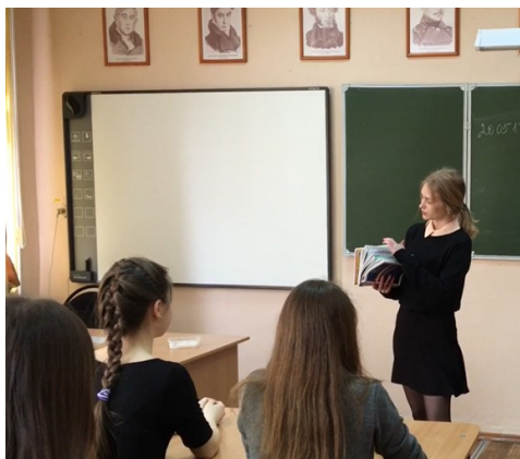
кадр из видеоролика 11 «а» класса